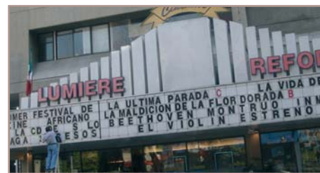
Lumiere Reforma, Mexico City

D'abord, une aide financière plus importante. Ensuite, la mise en place d'une mini structure de promotion du cinéma européen. A São Paulo, une attachée de presse locale pourrait alimenter le marché en news. Sur le modèle de ce que fait Unifrance pour les films français, nous aimerions pouvoir compter sur la présence des metteurs en scène et des acteurs lors du lancement des films. Enfin, la mise en place d'une Mostra qui présenterait les meilleurs films européens (achetés ou non), une fois par an, permettrait de mettre en avant les films européens. Lorsqu'ils sont présentés dans les Mostrs existantes (São Paulo, Rio), les films européens sont perdus au milieu de 300 ou 400 films.