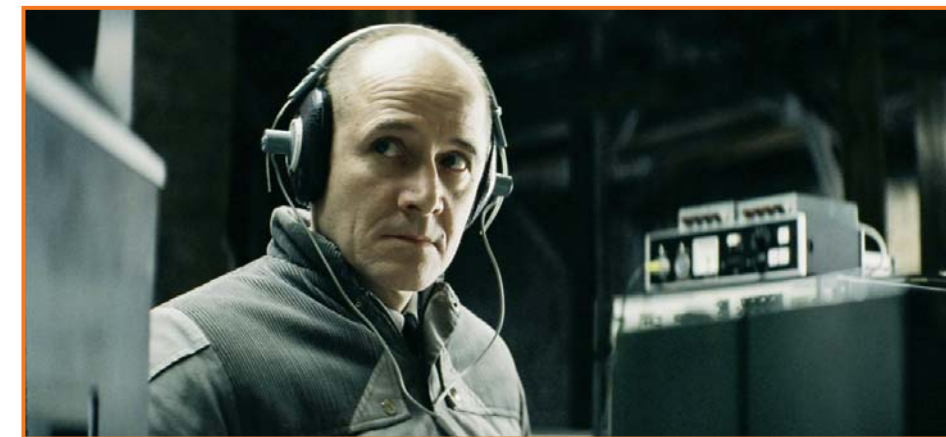
Das Leben der Anderen / The Lives of Others

En 2006, le réseau allemand s'est élargi avec sept cinémas supplémentaires. Berlin, avec 15 cinémas, concentre le plus grand nombre de salles Europa Cinemas.