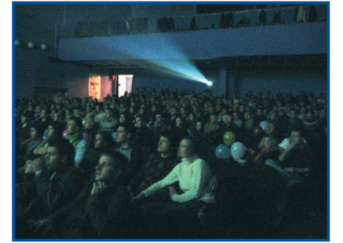
Kino Charlie, Lodz

tivals, avec les représentations culturelles de ces pays. The Paper will be blue , le dernier film de Radu Muntean, l'un des plus impressionnants de la nouvelle vague roumaine, a ainsi pu être vu par un public non négligeable, même s'il n'est encore sorti dans aucun pays européen. Quant au 11 ème festival du film européen , qui avait lieu au printemps, il est notamment passé par le Kino Apollo à Poznan et le Kino Charlie .