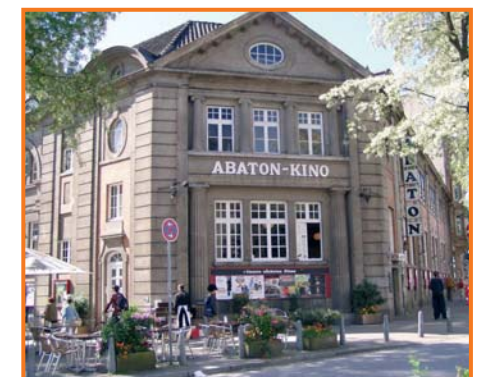
Abaton Kino, Hamburg

The German network grew in 2006, with seven additional cinemas. Berlin has the most network cinemas in Germany, with 15.