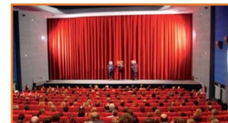
Kino Thalia, Potsdam

France remains the best represented country, however, with six titles among the top 50 films released in Europa Cinemas theatres.