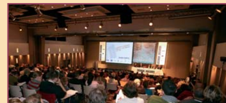
Conférence, Paris 2006

Après Prague en 2003 et Budapest en 2005 (et Paris en 2004 et 2006), la Conférence annuelle du réseau aura lieu du 15 au 18 novembre 2007 dans la capitale roumaine, à l'hôtel JW Marriott, situé à proximité du Palais du Parlement. Le développement du numérique dans les salles sera une nouvelle fois au centre des débats et une dizaine de films européens seront présentés en avant-première.