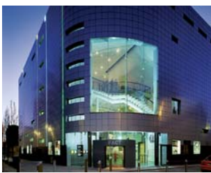
Picturehouse at FACT, Liverpool