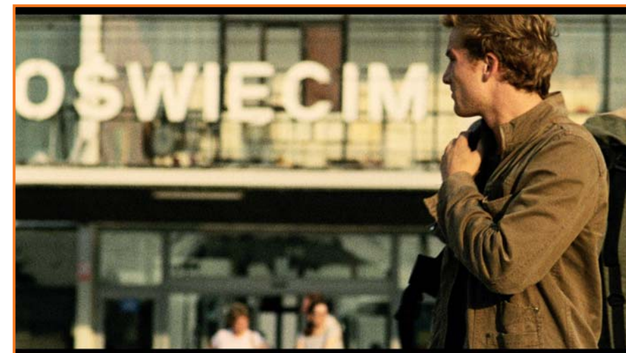
Am Ende kommen Touristen / And Along Come Tourists

Du côté des films documentaires, la diversité thématique et stylistique est à l'honneur, comme l'illustrent Andres Veiel ( Der Kick ), Philipp Groening ( Le grand silence ) et Romuald Karmakar ( Les discours de Hambourg ), tandis que Fatih Akin est devenu le représentant des réalisateurs germano-turcs qui marquent de leur empreinte la scène allemande. Akin est parvenu à une notoriété internationale avec Head on , récompensé par un Ours d'or, et voit maintenant un rêve se réaliser avec son nouveau film The Edge of Heaven , second volet de sa trilogie sur L'Amour, la Mort et le Diable, présenté en compétition au festival de Cannes.