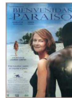
Vers le Sud

Our aim is to draw attention to European culture through cinema. Audiences interested in this area consider European films first and foremost as European before looking at their precise origin. These audiences are primarily made up of students, intellectuals etc., people who are looking for diversity in the field of cinema. We are trying to change this trend and to persuade the general public that there are European action films, comedies, etc. Above all, we are attempting to find European films which, through the message