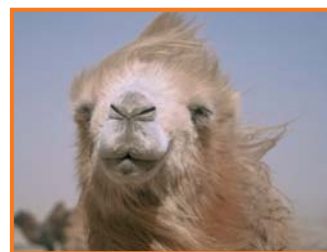
Die Geschichte vom weinenden Kamel / The Story of the Weeping Camel