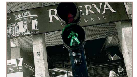
Reserva Cultural, São Paulo

When they are presented at existing festivals (São Paulo, Rio), European films get lost in a sea of 300 or 400 films.