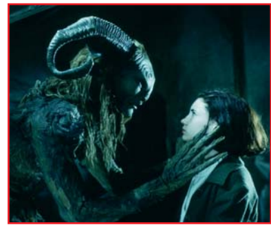
El Laberinto Del Fauno

Europa Cinemas soutient depuis deux ans la projection de films européens en numérique dans les salles des pays membres du programme MEDIA. Ce soutien prend son envol en 2006 : 19 salles atteignent les critères requis. Mais la frontière est nette entre le Royaume-Uni, où une offre de films européens existe, et le reste de l'Europe, où le nombre de films européens disponibles est très limité.